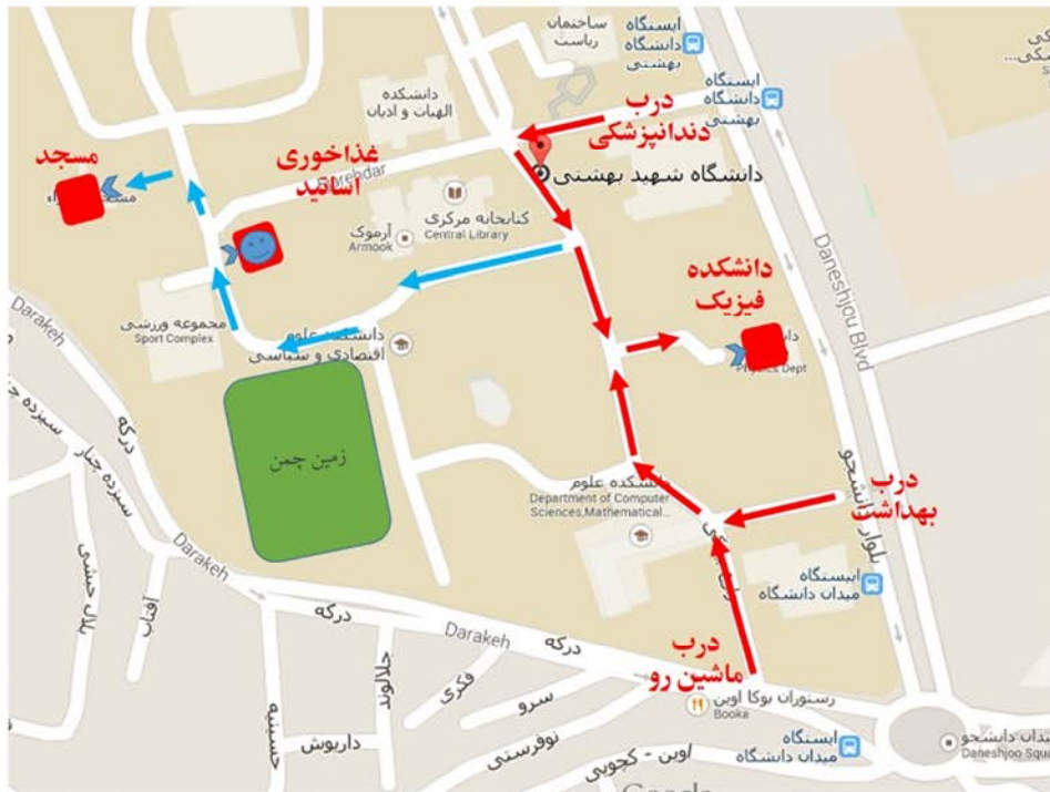
میدان شهید شهبازی

آدرس دبیرخانه: تهران - اوین - دانشگاه شهید بهشتی - دانشکده فیزیک.